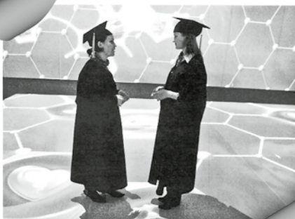
Магистр почти не виден

Российская Газета http://www.rg.ru/2013/03/07/unst.html